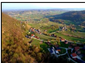
Pogled na Orešje iz Vike Peči