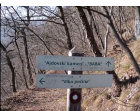
Slika iz poti po Orešju