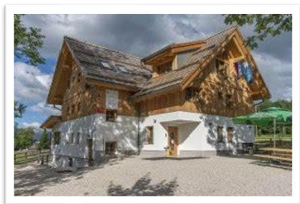
Koča na Uskovnici

Tokratni pohod nima omembe vrednih vzponov. Iz Rudnega polja (1350 m) nas čaka najprej spust do planine in kočje na Uskovnici (1154 m), kjer si oddahnemo. Sledi spust proti Bohinju oziroma vasi Stara Fužina (550 m), spustili se bomo najprej na planino Voje mimo slapu Mostnice in Koče na planini Voje ter si spotoma na poti do Stare Fužine ogledali priljubljena korita rečice Mostnice s Hudičevim mostom.