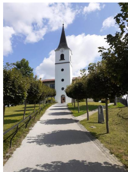
Cerkev Sv. Helene na Pertoči

Pa smo že v jesenskem delu letošnjega leta, v času, ko bo narava intenzivno pričela s spreminjanjem barv. Tokrat gremo v Prekmurje, točneje na 121. izlet četrtkarjev v Fuks grabo.